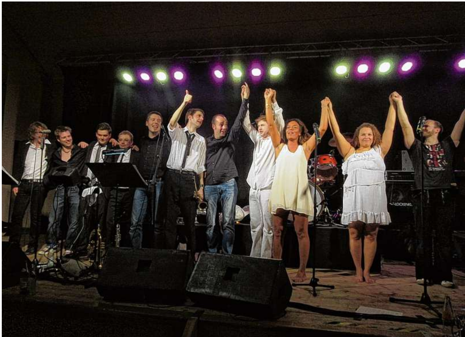
Musiker und Sänger von „Spinnich“ verabschiedeten sich vom Publikum nach einem tollen Konzert.